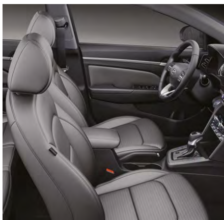
Ciemnoszare – Dark Gull Gray