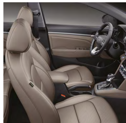
Beżowe – Light Taupe Beige