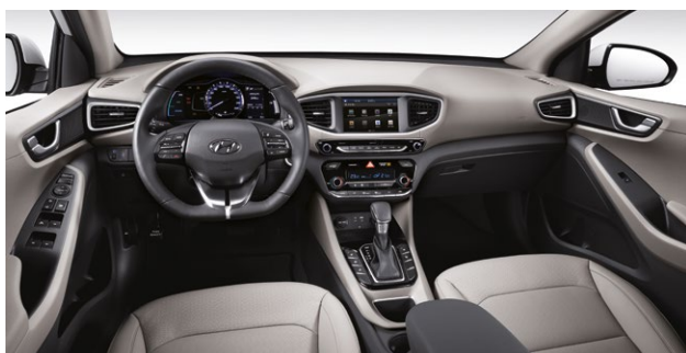
BEŻOWE (białe akcenty)