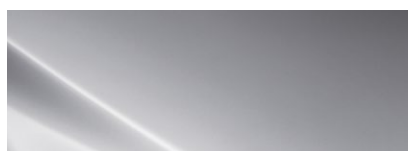
PLATINUM SILVER (T8S - METALICZNY)