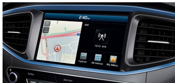
Nawigacja z 8" ekranem