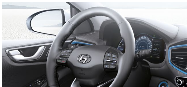
Skórzane koło kierownicy i gałka skrzyni biegów