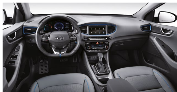
CZARNE (niebieskie akcenty)