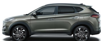
OLIVINE GREY (X5R - METALICZNY)