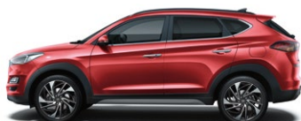
FIERY RED (PR2 - METALICZNY)