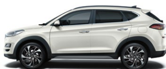
POLAR WHITE (PYW - BEZ DOPLĄTY)