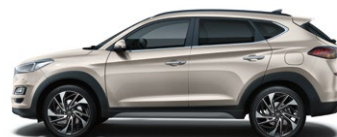
WHITE SAND * (Y3Y - METALICZNY)