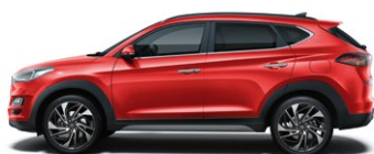
ENGINE RED (JHR - BEZ DOPLĄTY)