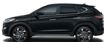
PHANTOM BLACK (PAE - PERŁOWY)