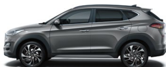
MICRON GREY (Z3G - METALICZNY)