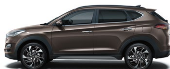
MOON ROCK (XN3 - METALICZNY)