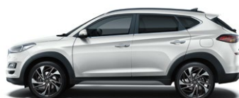
PLATINUM SILVER (U3S - METALICZNY)