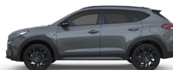
SHADOW GREY ** (TKG - SPECJALNY)

* Kolory U2U oraz Y3Y niedostępne w wersji N Line ** Kolor TKG dostępny tylko w wersji N-Line