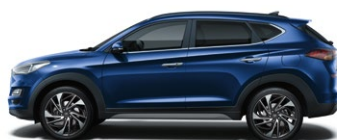
STELLAR BLUE (RWB - METALICZNY)