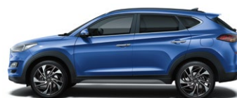
CHAMPION BLUE * (U2U - METALICZNY)