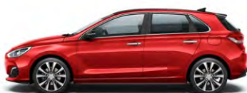
ENGINE RED (JHR - BEZ DOPŁATY)