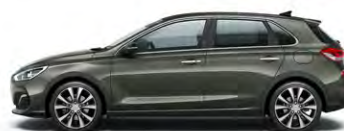
OLIVINE GREY (X5R - METALICZNY)