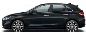
PHANTOM BLACK (PAE - PERŁOWY)