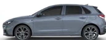
SHADOW GREY * (TKG - SPECJALNY)

* Kolor TKG dostępny tylko w wersji N-Line