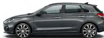
MICRON GREY (Z3G - METALICZNY)