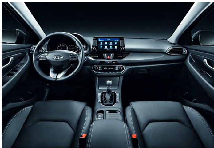
OCEANIDS BLACK (TRY)