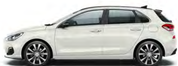
POLAR WHITE (PYW - BEZ DOPŁATY)