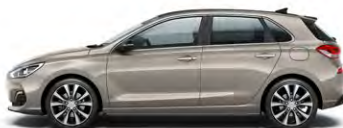
WHITE SAND (Y3Y - METALICZNY)