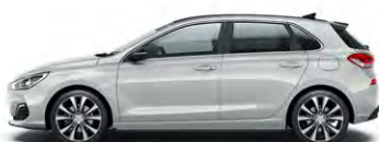
PLATINUM SILVER (U3S - METALICZNY)