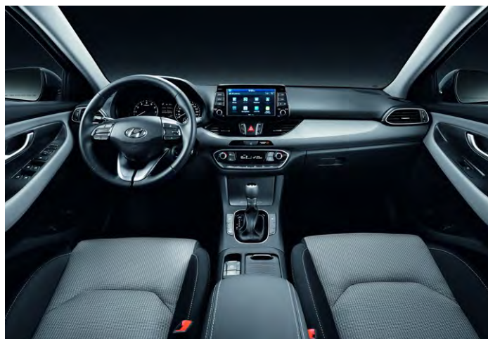
LIGHT SLATE GRAY (GSY)