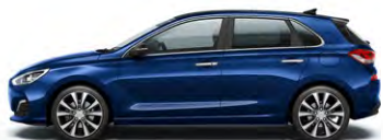
STELLAR BLUE (RWB - METALICZNY)