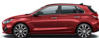
FIERY RED (PR2 - METALICZNY)