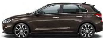
MOON ROCK (XN3 - METALICZNY)