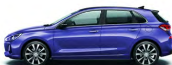
CHAMPION BLUE (U2U - METALICZNY)