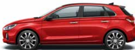
Engine Red (JHR - bez dopłaty)