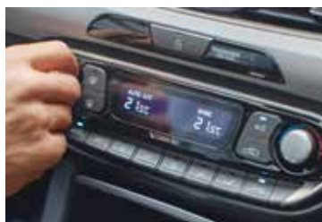
Dwustrefowa klimatyzacja automatyczna