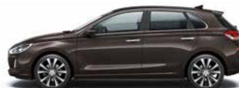
Moon Rock (XN3 - Metaliczny)