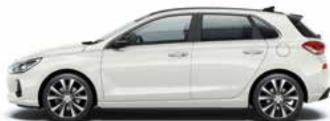
Polar White (PYW - bez dopłaty)

Każdy z nas jest inny i każdy ma własne preferencje oraz priorytety. Dlatego i30 Nowej Generacji jest dostępny w szerokiej gamie kolorów nadwozia, wykończenia wnętrza oraz stylowych felg. Wszystko po to, aby nadać Twojemu pojazdowi osobisty charakter. Możesz wybierać spośród wielu elementów wyposażenia dodatkowego i akcesoriów, aby dopasować auto do swoich wymagań.