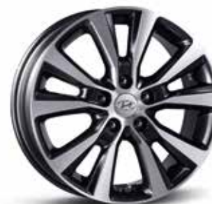
Felgi aluminiowe 17"