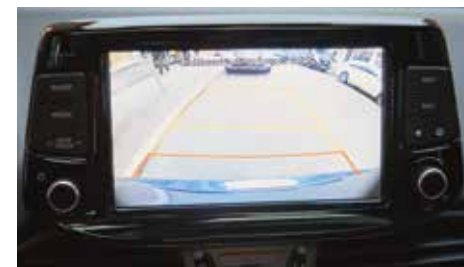
Widok z tylnej kamery

*Niekompatybilne smartfony wymagają użycia adaptera bezprzewodowego ładowania.