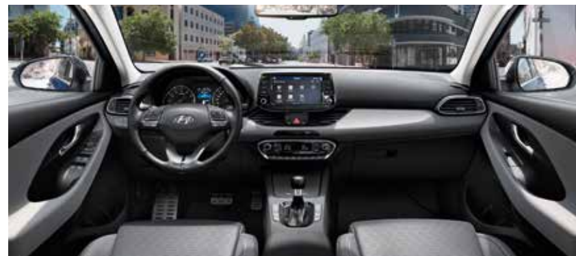
Light Slate Gray (GSY)