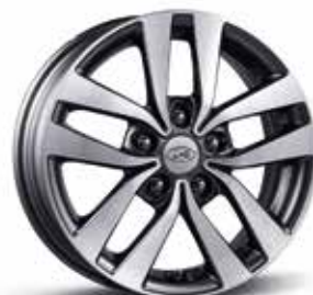
Felgi aluminiowe 16"