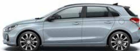
Clean Slate (UB2 - Metaliczny)