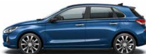
Stargazing Blue (SG5 - Perłowy)