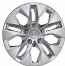
Felgi stalowe lub aluminiowe + kołpaki 15"