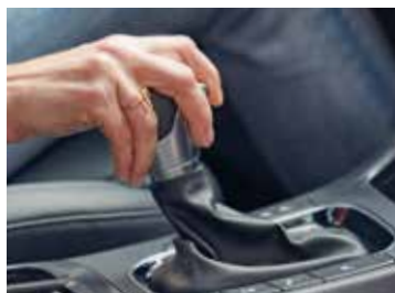
7-stopniowa, dwusprzętowa skrzynia biegów DCT

Średnie zużycie paliwa dla Hyundai'a i30 Nowej Generacji w cyklu mieszanym wynosi 3,6 - 5,6 l / 100 km, a emisja CO 2 - 95 - 130 g/km.