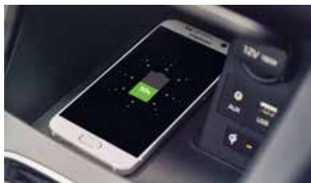
Bezprzewodowe ładowanie smartfonów*

*Niekompatybilne smartfony wymagają użycia adaptera bezprzewodowego ładowania.