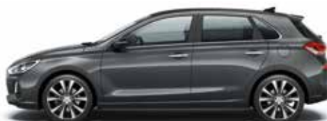
Micron Gray (Z3G - Metaliczny)