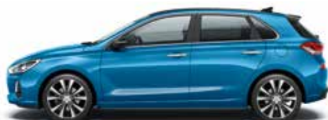
Ara Blue (R3U - Metaliczny)