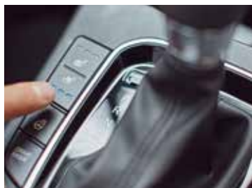
Podgrzewanie i wentylacja przednich foteli

Przemyślany i elegancki projekt oraz najwyższa jakość detali tworzą wnętrze o niezwykłej klasie. i30 Nowej Generacji jest jednocześnie jednym z najprzestronniejszych samochodów w swoim segmencie. Jeszcze więcej miejsca zyskano dzięki umieszczeniu elektrycznego hamulca postojowego na panelu centralnym między przednimi, wentylowanymi i podgrzewanymi fotelami. Poczucie przestrzeni oraz przyjemność z przebywania we wnętrzu dodatkowo potęguje panoramiczne okno dachowe.