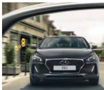
System monitorowania „martwego pola” (BSD). Alarmy informują o wykryciu innych pojazdów w tzw. „martwym polu”.