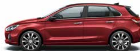
Fiery Red (PR2 - Metaliczny)