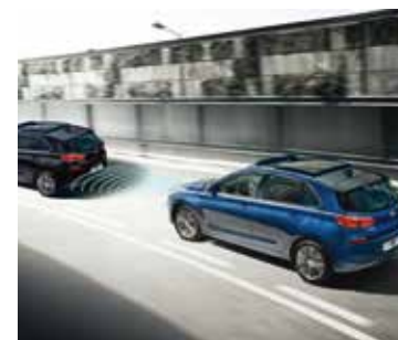
Aktywny tempomat (ASCC). Utrzymuje ustawiony przez kierowcę dystans do jadącego z przodu pojazdu, automatycznie regulując prędkość (dostępny tylko ze skrzynią 7DCT).