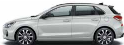
Platinum Silver (U3S - Perłowy)