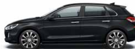
Phantom Black (PAE - Perłowy)