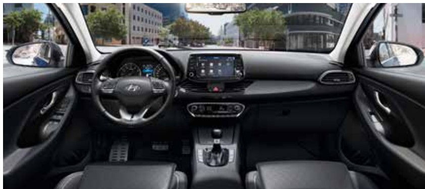
Oceanids Black (TRY)