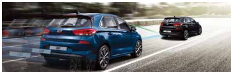
System autonomicznego hamowania (AEB). W przypadku wykrycia potencjalnego zderzenia z pojazdem lub pieszym, system w pierwszej kolejności uruchamia wizualne i dźwiękowe ostrzeżenia, a następnie automatycznie hamuje.