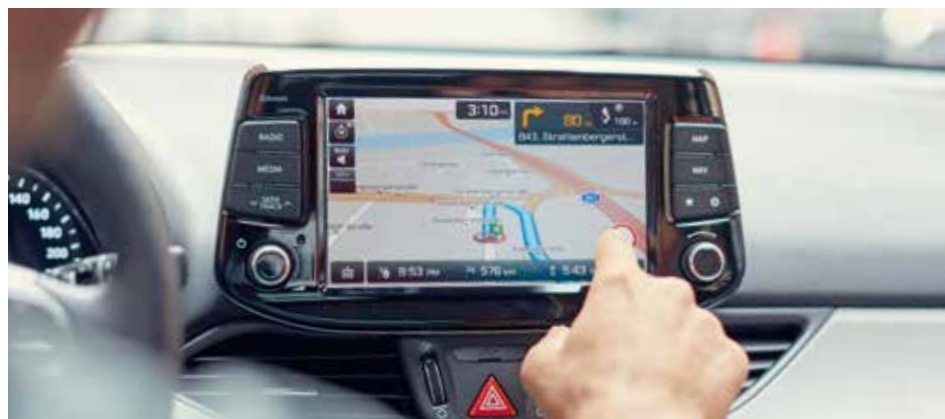
8-calowy ekran dotykowy z nawigacją

We wnętrzu i30 Nowej Generacji szczególnie wyróżnia się deska rozdzielcza i centralnie umieszczony 8-calowy ekran dotykowy, który zapewnia szybki i wygodny dostęp do nowej platformy nawigacji, łączności i multimedialnych. Dzięki LIVE Services jesteś w stałej łączności, a także masz zapewniony dostęp do rozrywki przez całą podróż.