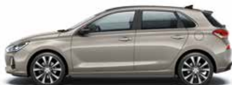
White Sand (Y3Y - Metaliczny)