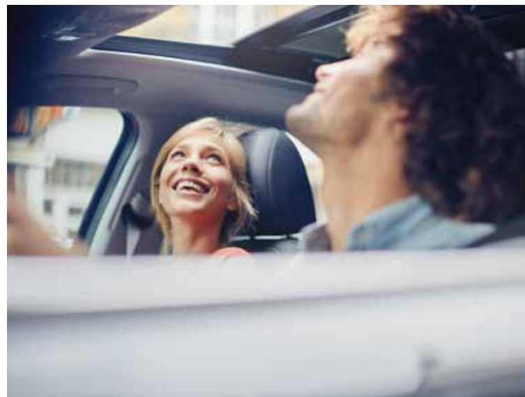
Panoramyczne okno dachowe